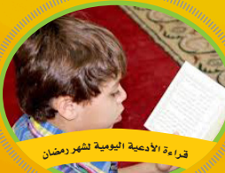
قراءة الألفية اليومية لشهر رمضان