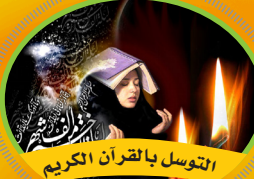
التوسل بالقرآن الكريم