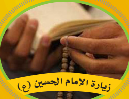
زيارة الإمام الحسين (ع)