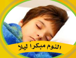
النوم مبكرا ليلا