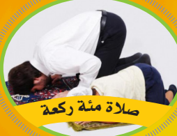
صلاة مئة ركعة