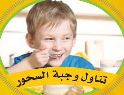
تناول وجبة السحور