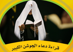
قراءة دعاء الجوشن الكبير